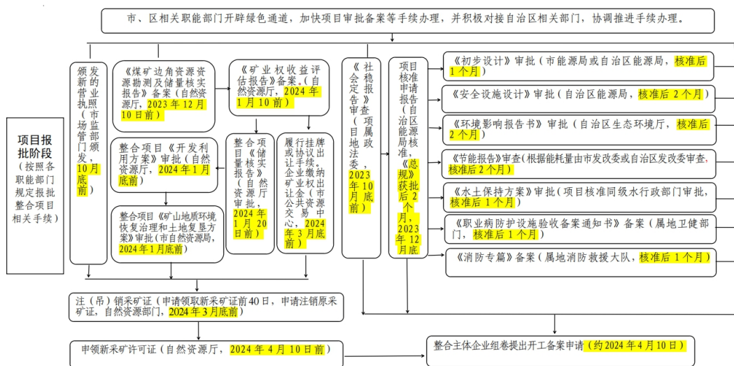
图表 6：乌海市煤矿矿权整合工作流程图（项目报批阶段）

根据乌海市煤矿矿权整合工作流程，目前正处于项目报批阶段，在 2024 年 4 月 10 日左右，整合主体企业组卷要提出开工备案申请。在内蒙古自治区自然资源厅官网上还并未查询到有关乌海市新申领的采矿许可证信息，预计将进一步加快乌海各露天煤矿的采矿证注（吊）销工作。